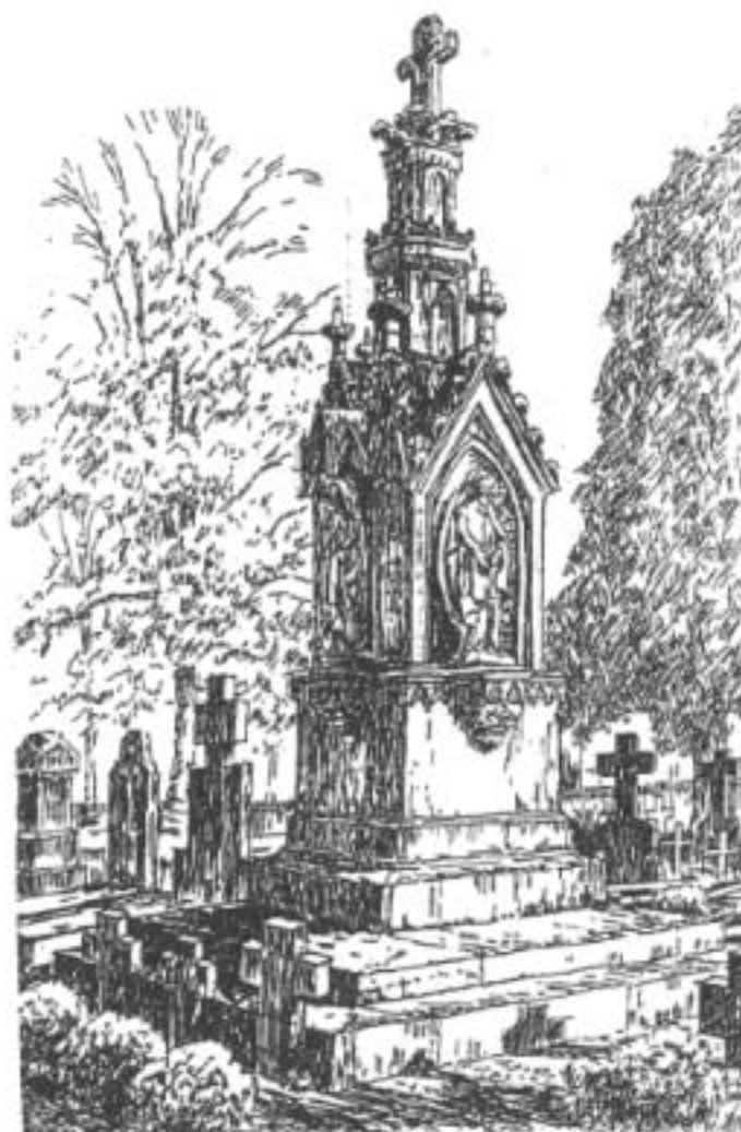
Het monument Guillon-Engels